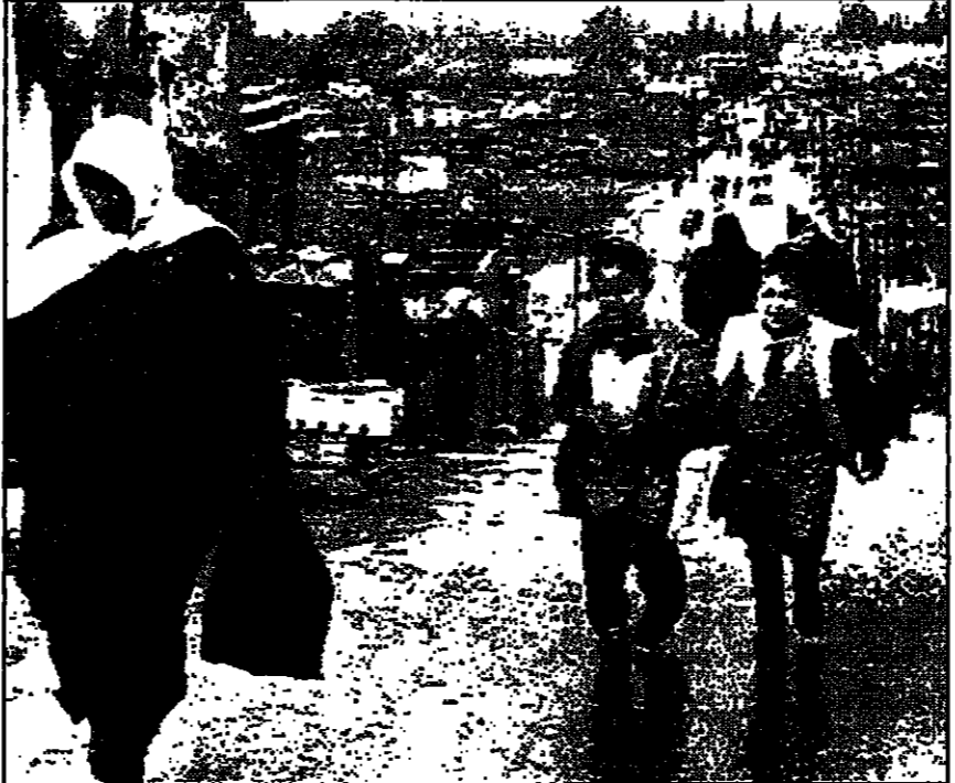
انزعج كيف احتال على شرطه العام لينجز ما هو خاص؟ كيف قرا وتتي كتبه بل ملأنا بيبوع، هو السؤال الأجنرب والأسبقية والأكثر مشروعية في مثل هذا الوضع...